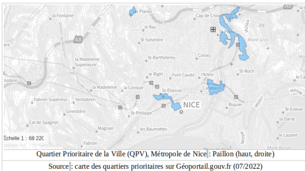
Figure 1 : Quartier prioritaire de la ville (QPV), Métropole de Nice

D'abord initiée par la Circonscription de Nice 7 (« Nice-Saint-André ») à partir d'une préoccupation liée aux difficultés des élèves dans les domaines du lexique et de l'entrée dans l'écrit, cette recherche a été soutenue en 2013 par l'Institut Français de l'Éducation (IFÉ) et la Direction Générale de l'Enseignement SCOLAIRE (DGESCO). Bientôt reconfiguré dans un dispositif expérimental avec l'appui de l'Université de Nice (UNS), via son équipe d'accueil en Éducation, le LÉA « Nice-Nucéra » a regroupé 5 chercheur·e·s, 29 professeur·e·s des écoles (dont au début 2 « Plus de Maitres Que de Classes »), 6 représentant·e·s du secteur associatif, 2 personnels de la Métropole et 5 bibliothécaires. Les effectifs d'élèves concerné·e·s se sont élevés à 237 en année n, 221 en année n+1, et 167 en année n+2, inscrit·e·s pour une part significative d'entre eux dans les classes de Petites à Grandes sections de maternelle.